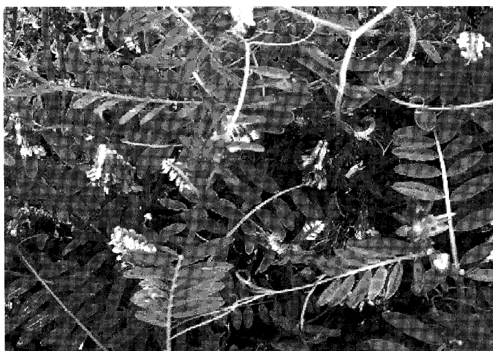
写真1 ヘアリーベッチ

ヘアリーベッチは、レンゲよりも雑草抑制力が強く、耐虫性にも優れるので、全国各地でレンゲに替わって休耕田管理に徐々に普及し始めている。播種は、暖地では10月～11月、北海道や東北の寒地では4月～5月が良い。播種量は、10アール当たり3～4kgが適当である。散播するだけで雨を待って発芽するが、軽く覆土をすることで発芽率が向上する。種子は大手の種苗会社で販売され、農協などを介して入手可能である。秋まきした場合、